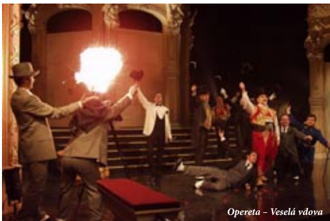
Opereta – Veselá vdova

V súčasnosti je poslancom Národnej rady SR a angažuje sa v riešení otázok slovenskej kultúry. Spolupracuje so Slovenským rozhlasom a Slovenskou televíziou, zároveň pedagogicky pôsobí pri výchove hercov na Akadémii umení. Na scéne Opery SND vystupuje v postave Bogdanoviča v Lehárovej operete Veselá vdova .